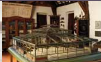
Modèle de marché alimentaire réalisé à Argenteuil sur les plans de Baltard