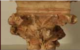
Chapiteau gothique du XIII e siècle retrouvé sur le site de l'abbaye Notre-Dame // coll. Musée d'Argenteuil