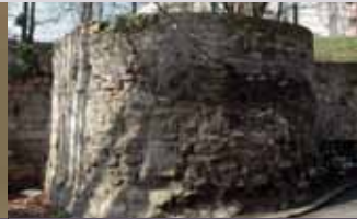
Vestige de la muraille d'Argenteuil dont la construction a été autorisée par François I er