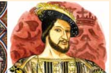
Illustrations de Frédéric Rich, extrait du livre « Argenteuil, l'histoire de ma ville »