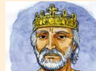
Illustrations de Frédéric Rich, extrait du livre « Argenteuil, l'histoire de ma ville »