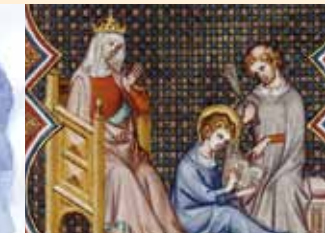
L'apprentissage de Saint Louis « Heures de Jeanne de Navarre » © BNF // Napoléon III © DR