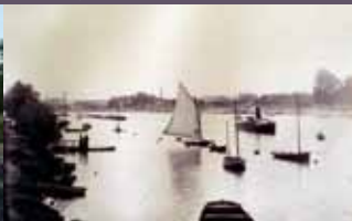
Le Roastbeef sur la Seine à Argenteuil, voilier de compétition de Gustave Caillebotte