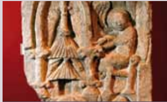
Bas-relief du XI e siècle retrouvé sur le site de l'abbaye Notre-Dame