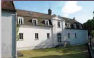
Ancien hôpital d'Argenteuil